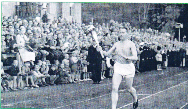
Maratonløber bringer den olympiske ild ind på Århus Stadion, 1952. Brabrand-Årslev Lokalarkiv.

Dit lokalarkiv registrerer og ordner alt indkommet materiale, så det let kan