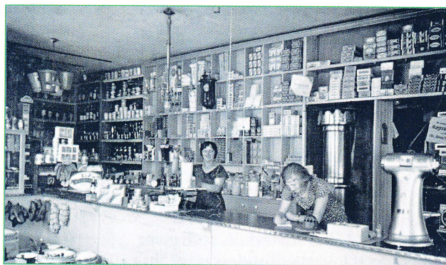
Købmandsbutik i Damme. 1930'erne. Lokalarkiv for Møn.