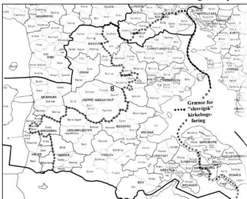
Område med fortsat slesvigsk kirkebogsføring efter 1812-14

Kortet, til venstre, viser (uden ansvar) afgrænsningen for den bibeholdte "slesvigske kirkebogs-føring" på grundlag af "grænsekontrol" foretaget på arkivalieronline. Sønderborg by og sognet Kegnæs på Als, hørte af indviklede historiske årsager under Slesvig stift, så de kunne fortsætte med at føre kirkebøger efter "slesvigsk skik", mens sognene på resten af Als, som hørte under Fyns stift, indførte de skematiske kirkebøger.