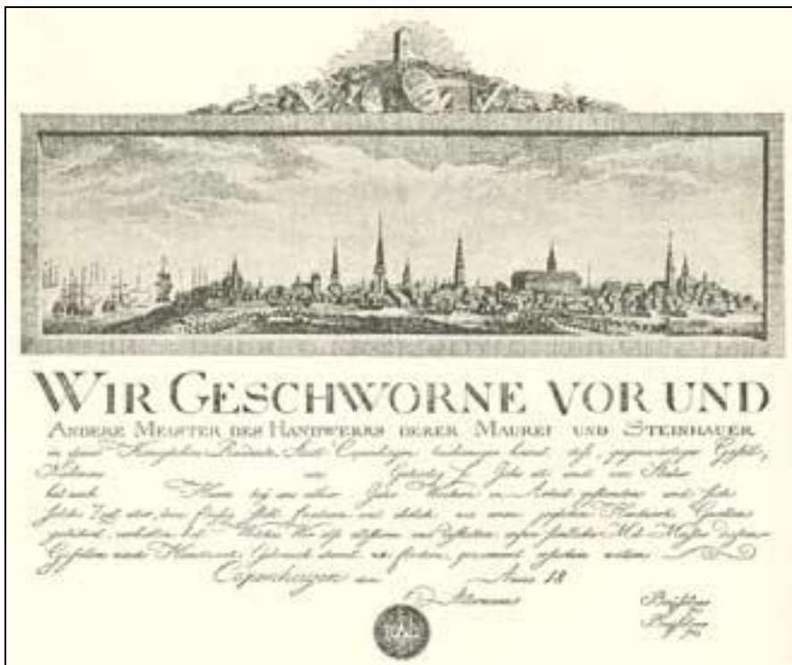
Et svendebrev fra ca. 1785

(Af Kai Aurbo, fundet på Nettet "www.Bagklogskab.dk")