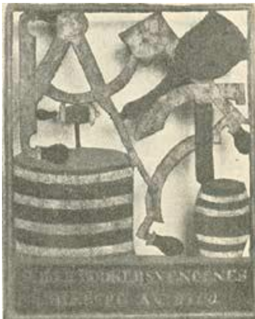
Stueskilt fra Odense Bødkerlaug.

Herinde blev den rejsende svend modtaget af krofa'er. At være krofa'er var ofte en bestilling, der gik på tur mellem mestrene i faget, og en stilling, som var meget eftertragtet. For selv om den ofte gav en del besværligheder, tjentes der som regel gode penge på den.