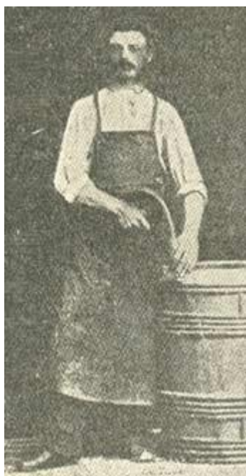
En bødkersvend med sit svendestykke.

Oldgesellen visiterede den nyankomne og så bl.a. efter, at han ikke havde fnat, en meget frygtet sygdom blandt håndværkerne, der jo ofte brugte samme redskaber.