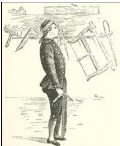
En snedkersvend fra ca. 1780.

Når en sådan svend kom til en fremmed by, måtte han først aflevere sin kårde i vagten, for der var tider, da endog hver håndværkersvend bar sin lille lette "Degen" ved siden. Derefter gik han ind til byen og søgte efter svendeherberget.