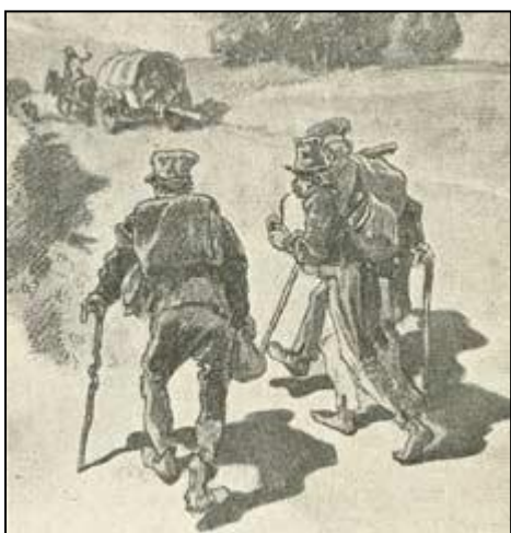
Håndværkssvende på valsen. Tegning af Nørretranders.

Svenden var ligesom drengen del af mesterens husstand, boede hos ham og spiste ved hans bord og betragtede i virkeligheden både mester og madammen som en far og mor. Kom han på gale veje, ja så reddede mester ham ud af kniben, og var det en særlig flink svend, betalte han måske også hans bøder af sin egen lomme.